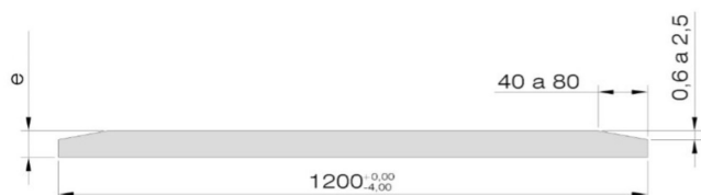
Cotas expresadas en mm.